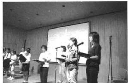
本番前のリハーサル風景

ピースアクション2007の取組みは、リレー行進に変わるあらたなアピール行動として3年目を迎え、昨年のピースキャンドルの継続開催を柱に、幅広く誰もが参加でき、平和の想いを強く訴えることのできる企画を積み上げてきました。今年は、ならコープ「WITHユニセフの会」からユニセフ活動の現状について、また朗読劇を会員生協組合員による手作り公演が行われました。