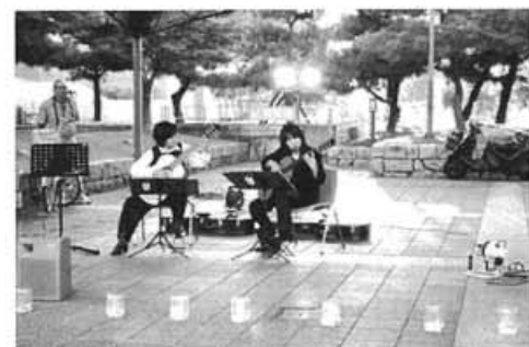
「ルージュ」によるミニコンサート

□会館入口前広場では、ピースキャンドルを点灯、キャンドルには、事前に組合員から寄せられた平和への願いを綴ったメッセージカードを巻きつけ、ロウソクには般若寺「平和の塔」よりいただいた火を点灯しました。クラシックギターによるミニコンサートなども開催し、夕暮れの薄明かりの中に浮かび上がるキャンドルやギターの音色に、観光客も足を止め聞き入る姿も見られ、落ち着いた雰囲気の中で行く夏を惜しみ、平和への思いを深めました。