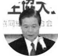
食品・生活安全課 堀川課長