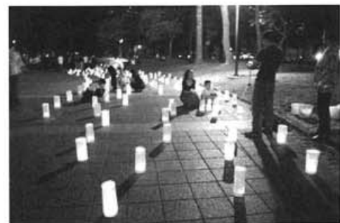
ピースキャンドル点灯

□参加者アンケートからは、映像ではなく言葉で伝える情景に、違った感動と平和への思いを深めることが出来たと言う声が多く寄せられ、特に子供たちの朗読参加に対して、若い世代への継承への評価と必要性についての感想も多く寄せられました。