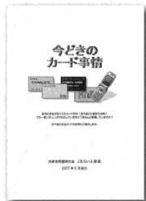
「今どきのカード事情」冊子

「PITAPAって、機能はいくつ?」決済機能付きやメンバーズやポイントカードのようにサービスだけのカードといろいろ。次々多機能化と系列化が進んでいます。一つのカードにいくつもの機能がついていますが、使いこなせていますか?