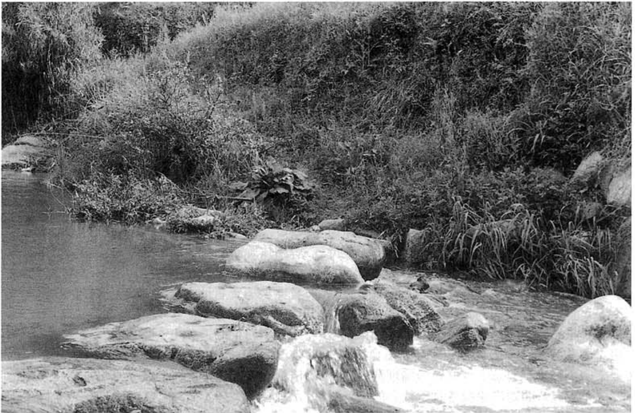
飛鳥川の石橋 いははし

あすかがは あす いははし 明日香川 明日も渡らむ 石橋の 遠き心は 思ほえぬかも