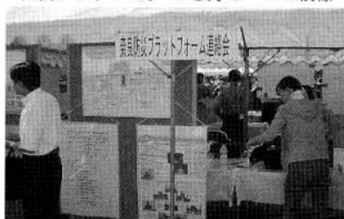
防災プラットフォーム展示ブースの様相

8月26日桜井市天理教敷島周辺で行われ、47団体約750名が参加しました。県連は、防災プラットフォーム委員会副幹事団体として参加。展示ブースで同委員会の設立趣旨や機構について、また実際の有事において、どのような活動展開が可能かを紹介。ボランティア支援を中心に災害時対応の中心的組織として今後さらに活動の具体化を進めます。