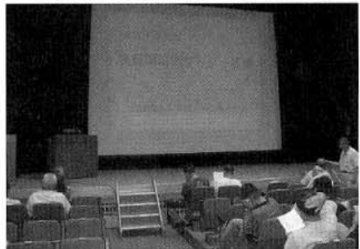
写真は、9月3日「第2回」講演風景

後段実技として、エリア別消防本部各担当による普通救命講習が開催され、気道確保とあわせた人工呼吸の仕方、AED（自動対外式除細動器）の使い方、心臓マッサージの仕方等心肺蘇生の基礎知識について実体験型学習が行われ、目からウロコの思いで非常に貴重な体験が出来ました。特に、普通救命講習は、災害に関わらず緊急事態に備える上で、一度は体験しておくことは重要であると感じた。また、AEDの設置が拡大し、その有効性のこの点から営業所レベルの設置などの拡大を推進する必要があると感じました。