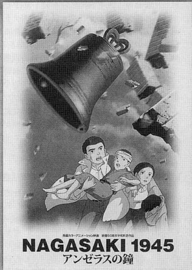
長編カラーアニメーション映画 被爆50周年平和祈念作品 NAGASAKI 1945 アンゼラスの鐘

会館前「つどいの広場」 時間：18:00～18:30 平和への思いをメッセージにのせて、ピースキャンドルに灯を灯します。(雨天時は、キャンドルは中止)