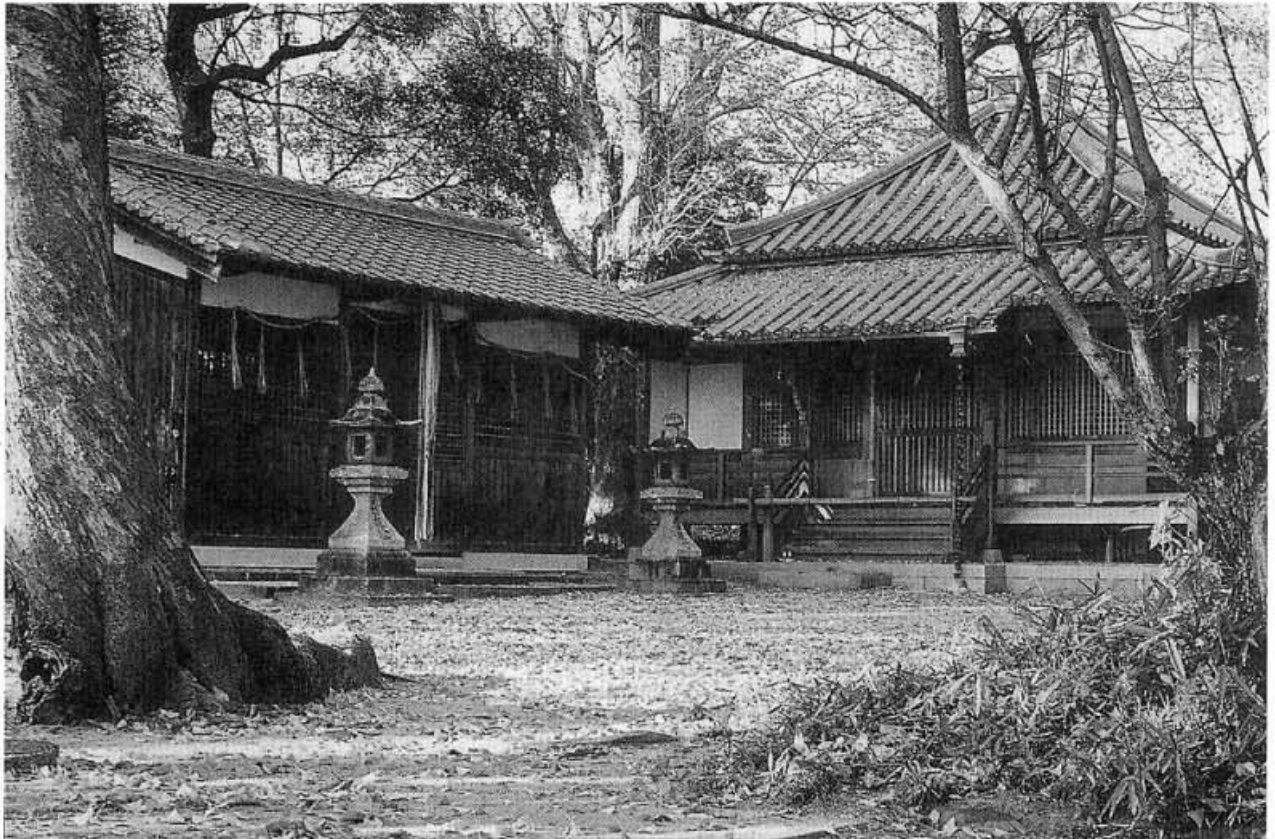
竹田の原・竹田神社

うち渡す 竹田の原に 鳴く鶴の たづ 間鳴く時なし まな わが恋ふらくは 大伴坂上郎女 おおとものさかのうへのいらつめ