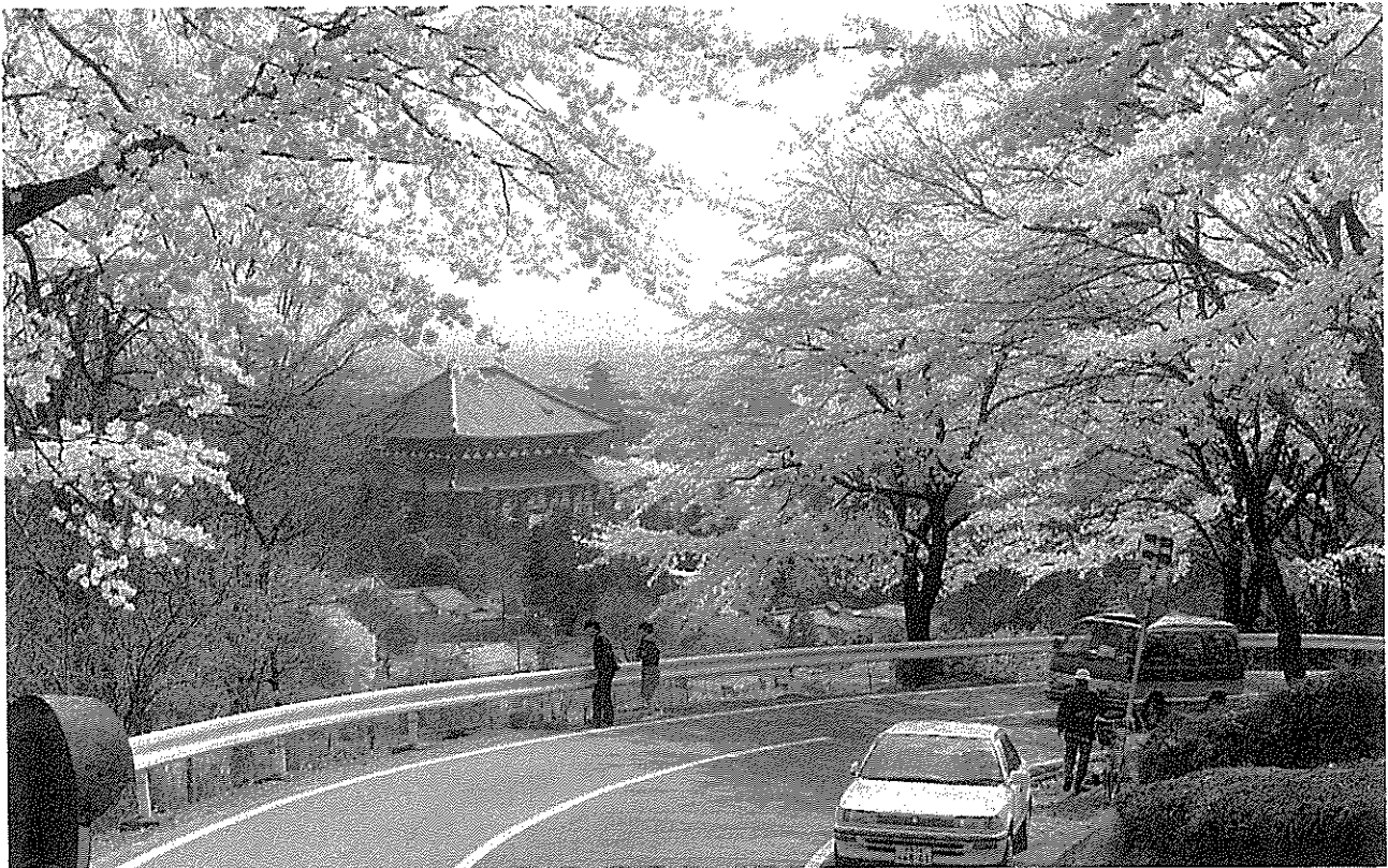
桜花にけむる 大仏殿・興福寺五重塔

万葉集の歌は不思議と私たちの心をとらえる。それは、人々の生活にねざし、生活のなかから生まれた歌が多いからでもあろう。あの街角、この山のふもと、社の片隅に、喜びや悲しみ、あふれる感動を口ずさんだ万葉の人々の息づかいが聞こえる。ペンとカメラを手に万葉の息吹を求めて歩いてみることにしました。